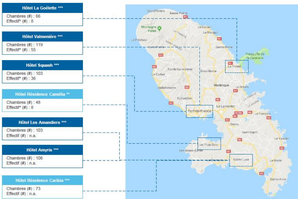
Martinique – Répartition géographique, Dec17