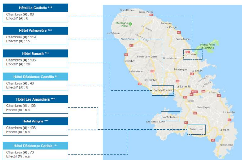
Martinique – Répartition géographique, Dec17